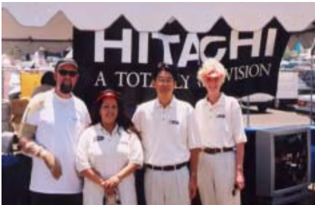
Employees sharing information with the community

ALS(筋萎縮性側索硬化症):全身の筋肉が次第に萎縮し、体を動かせなくなる原因不明の難病。