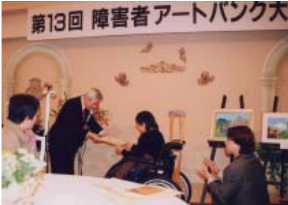
The Art Bank Award Ceremony

日立キャピタルは1992年以来、障害者アーティストの絵画を各種販促物などに使用することを通じて「作品発表の確保」や「経済的自立」を支援しています。昨年11月9日、「第13回障害者アートバンク大賞表彰式」が東京の会場で開催され、「日立キャピタル特別賞」を提供しました。