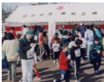
Participants from Hitachi Metals