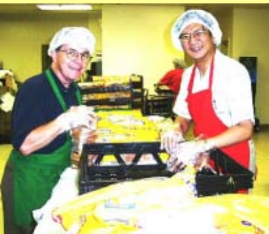
Working hand in hand to save the community

Hitachi Corporate Office, D.C. and the Hitachi Foundation helped prepare salads and packed foods at "Martha's Table", which supplies 3,000 dishes every day to people living on the streets.