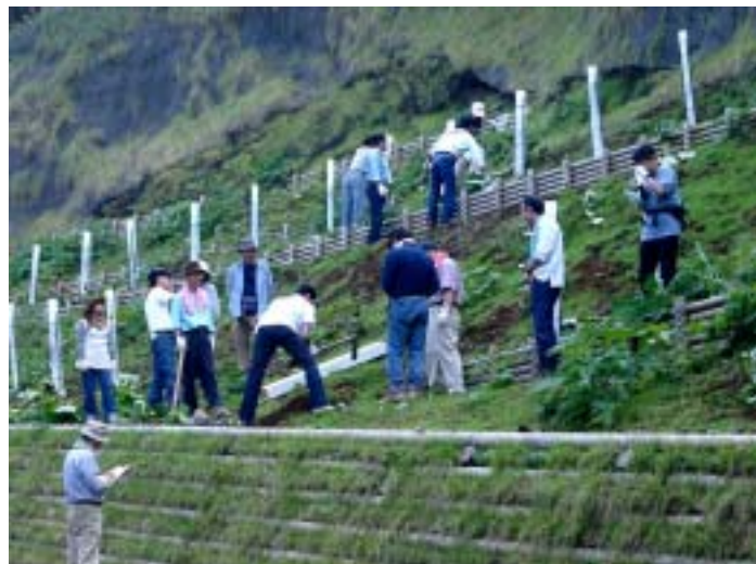
Employees restoring the natural environment

日立キャピタルが支援する社員環境ボランティア「法人の森林エコクラブ」は、静岡県中伊豆町「日立キャピタルの森林」にて、同森林の一部崩落による治山工事をした土地の地盤強化と自然林の復活を図り、「法人の森林」制度参画 10 周年記念植樹を実施しました。