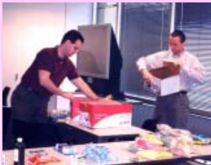
Collecting personal care products

日立ハイテクノロジーズアメリカ社は衛生用品寄付運動により100名分の寄付を集めました。