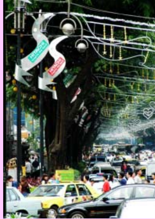
Christmas decorations above the streets of Singapore

過去 12 年間、日立アジア及び日立グループ各会社はオーチャードロードにクリスマスイルミネーションのスポンサーをしています。これまでに 1,500 万円相当額の寄付をしたことになり、シンガポール首相より地域貢献賞が授与されました。