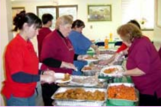
In the spirit of Thanksgiving

日立金属アメリカ社のボランティア 14 名は、地元アパート在住のお年寄りや体の不自由な人約 100 名に感謝祭ディナーを提供しました。