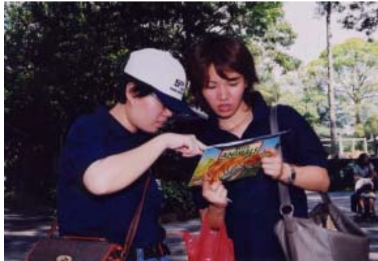
Teaching the intellectually challenged about animals