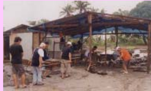
Helping to build a new house

日立コンピュータプロダクツ(アジア)社の日立アウトリーチプログラムは、貧困者やホームレスのための家作りに参加しました。