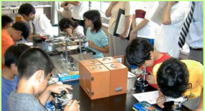
Elementary School students observing the micro world

日立計測器サービスは新宿区立花園小学校4年生の「総合学習」で自然界の神秘・科学技術のすばらしさを体験学習する授業のサポートをしました。