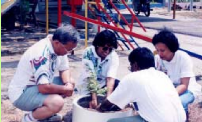
Planting seedlings with the mentally challenged

日立セミコンダクタ(マレーシア)はペナンにある養護学校をサポートしています。学校の清掃・植樹を行うとともに教室や校庭設備のための基金も設立しました。