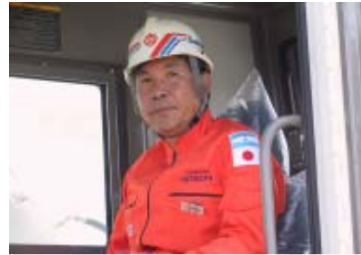
Expert from Hitachi giving hands on training

山梨日立建機はカンボジアに地雷処理機を2台納車し、現地で操作指導を行いました(年間約1,300個の地雷を処理)。この機械は土壌改良や道路建設にも応用することができます。