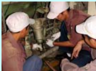
Trainees receiving on-the-job training

日立フェライト社は地元高校・大学生60名を対象に3ヶ月間の職場研修を実施しました。