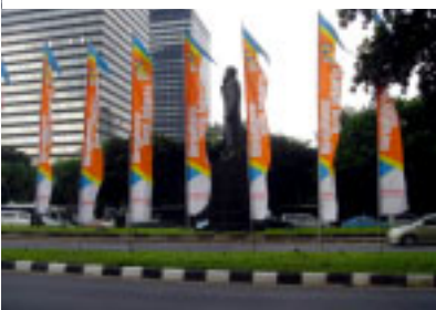
Hitachi banners on main street in Jakarta

Hitachi Asia's Jakarta Office coordinated six group companies in Indonesia to participate in Jakarta's 478th Anniversary (a month long celebration), the second time for them to carry out such a joint community activity. A total of 110 Hitachi Banners were installed along Jakarta's main business street to show Hitachi's participation.