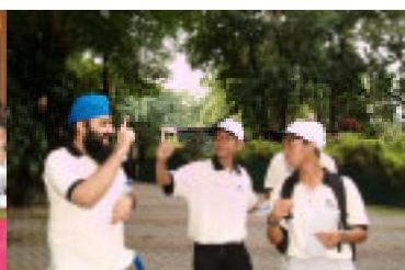
Community work: HYLI student learning about environmental conservation with deaf students