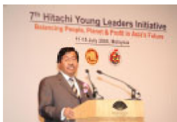
Guest of Honour, YB Dato' Dr. Shafie Mohd Salleh, Malaysia's Minister of Higher Education

インドネシア、日本、マレーシア、フィリピン、シンガポール、タイより将来有望な学生24名を選抜し、公開討論会・学生分科会・地域貢献活動からなる5日間のプログラムを通してアジアの将来のリーダー育成に貢献しています。今回は本年7月に、「アジアの将来における人・自然環境・利益のバランス」というテーマでマレーシア・クアラルンプールにて開催されました。