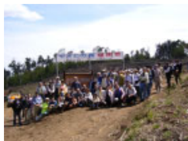
Planting activities in Yasatomachi

To contribute to the control of global warming, Hitachi High-Technologies (HHT) held a tree-planting festival in Yasatomachi, Ibaraki prefecture on April 23.