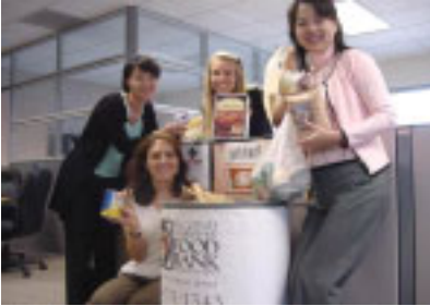
A blessing to the community!

This year, 23 Hitachi group companies in 33 locations in the United States and Canada collected 57,406 pounds of food, a 65% increase in donations over last year's Food Drive.