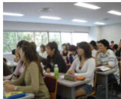
Students earnestly listening to a lecture

日立製作所は、早稲田大学国際教養学部にて日立の事業戦略や事例を通じて、グローバル市場における日本企業のビジネス展開について講義を行う「日立ビジネス講座」を9月から半年間実施しています。日立の事業を実際に遂行している執行役、本部長、部長等が講師を担当し、英語で行う講義は研究開発やM&A、ブランド戦略など実際の事業戦略をテーマに取り上げています。国際的に活躍する人材の育成を目指す本学部にて講座を実施することにより、学生の日立グループに対する理解促進、将来の国際社会のリーダー、特にビジネスリーダーの育成支援に貢献していきたいと考えています。