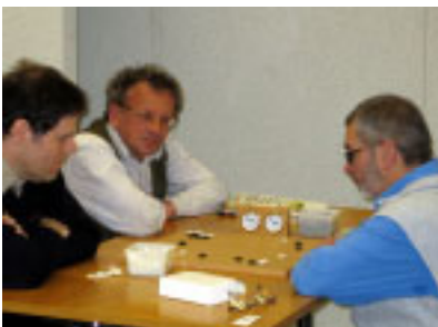
Who will be the winner?

Hitachi Europe Ltd. hosted the European Paris Go Tournament on April 24/25, 2005 in Maidenhead, UK, which attracted hundreds of professional Go players from across Europe to play this ancient Chinese board game. They also hosted the Maidenhead Furze Platt Go Tournament in January, and were the main sponsor for the Cambridge Mind Sports Olympiad 2005.