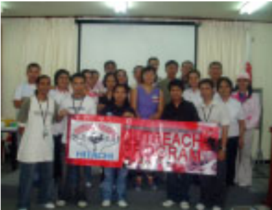
Outreach and some of their blood donors

The Hitachi Outreach Program, a volunteer group of Hitachi GST Laguna employees, held blood donation sessions on May 17 and 25, 2005 sponsored by the Philippine National Red Cross (PNRC). The blood donations were observed by visitors from the Cambodian Red Cross along with a physician and a representative from PNRC.