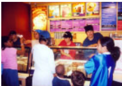
Selling icecream at Ben & Jerry's PartnerShop

The Hitachi Foundation provided a grant to the Latin America Youth Cener (LAYC) to help expand their training for disadvantaged youth through a business community partnership "Ben & Jerry's PartnerShop". The grant helped LAYC to open a new Ben & Jerry's ice cream shop in Washington, D.C. where youth can develop their work skills and life skills while working there.