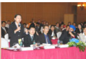
HYLI students and audience at the HYLI Forum