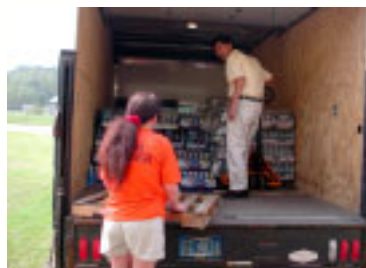
Loading bottled water for hurricane victims

ハリケーン「カトリーナ」の災害に対する迅速な対応として、日立製作所、日立ファウンデーションおよび北米日立グループ会社はその災害により犠牲となった人々や、影響を受けた地域の復興援助の為に総額100万ドルの寄付をすることを約束しました。また、その寄付に加え、北米の日立グループの社員も基金を集めることに協力しました。