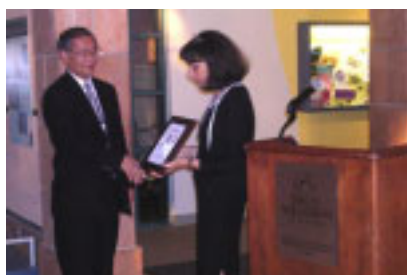
Special award ceremony at the conference

The 2005 Hitachi Community Action Partnership (HCAP) annual conference co-hosted by The Hitachi Foundation and Hitachi America, was held in June in California. Conference topics ranged from effective community relations strategies to strengthening the quality of activities within each company. The conference also highlighted the Foundation's 20th anniversary and included a special dinner to honor the occasion.