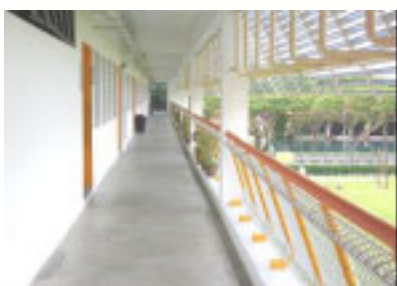
Plants & watering system produce cooling effect

Hitachi Semiconductor Singapore Pte. Ltd. has participated in the National Environment Agency's Adopt-a-School-Program by sponsoring Hai Sing Catholic School's environmental projects in Singapore. One project is underway to cool down the temperature of class room with plants and a watering system.