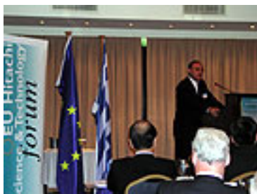
Guest speaker at the forum

EU日立科学技術フォーラムは、1998年より「科学・技術が欧州社会の抱える問題にいかに関与できるか」をテーマに、欧州委員会メンバーや研究者、ビジネス・パートナー等が参加し、欧州にて毎年開催しています。これまでにフランス、ドイツ、アイルランド、ベルギー、ハンガリー、スウェーデンで実施しており、今年は、ギリシャのアテネ市にて第8回フォーラムを5月20日から22日にかけて開催しました。「都市の未来に技術はどう貢献できるか」を主題とし、アテネ市関係者や都市の専門家も含め、約130名が活発な議論を行いました。