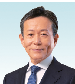
2025年度における出席状況