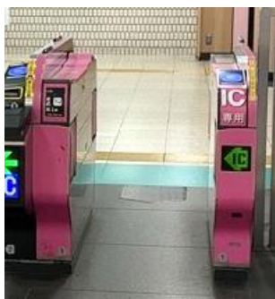
既存改札機(池袋駅)

顔認証などの機能を既存の改札機にアドオンできる仕組みにより、改札機本体の新規入れ替えを伴わず、鉄道事業者の導入にかかる初期コストや工期を抑制でき、スピーディーな実装が可能です。